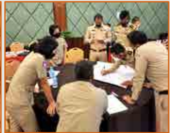
វគ្គបណ្តុះបណ្តាល ការអង្កេតអត្តសញ្ញាណប៉ះទង្គិចផ្លូវចិត្តជនរងគ្រោះដោយអំពើជួញដូរមនុស្ស ចំនួន ៧វគ្គ សរុប ១២៨នាក់ (ស្រី៥២នាក់) ឧបត្ថម្ភគាំទ្រដោយ IOM