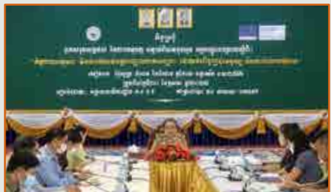
(តាមប្រព័ន្ធអនឡាញ) វគ្គបណ្តុះបណ្តាលស្តីពី៖ ក្រមសីលធម៌នៅទីតាំងត្រូវធ្វើចត្តាឡីស័ក ដើម្បីការពារសិទ្ធិ និងសុវត្ថិភាពស្ត្រីនិងកុមារ ព្រមទាំងពលករទេសន្តរប្រទេសក្នុងការទប់ស្កាត់ការជម្លិះភក្តាត ជាពិសេស និងការកំណត់អត្តសញ្ញាណបច្ចេកសាស្ត្រជនរងគ្រោះដោយអំពើជួញដូរមនុស្ស - ចំនួន ៤លើក មាន ៤វគ្គ សរុបចំនួន ២,២៣៧ នាក់