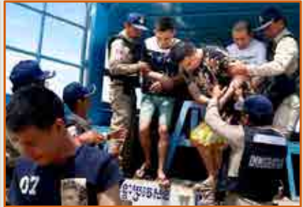
ផែនការប្រតិបត្តិការ និងសកម្មភាពបង្ក្រាប សង្គ្រោះ និងបណ្តេញចេញ