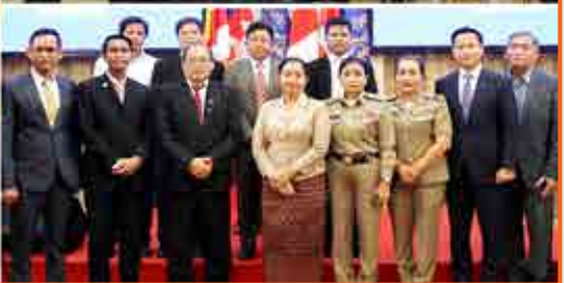
សន្និសីទកាសែតនៅទីស្តីការគណៈរដ្ឋមន្ត្រី