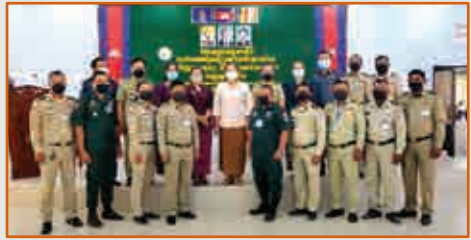
វគ្គបណ្តុះបណ្តាលកំណត់អត្តសញ្ញាណជនរងគ្រោះដោយអំពើជួញដូរមនុស្ស ដើម្បីផ្តល់សេវាសមស្រប មាន ១០វគ្គសិក្សាកាមសរុប ៧៤៦ នាក់ (ស្រី៦៩៥នាក់) ឧបត្ថម្ភគាំទ្រដោយ Asean-Act, A21, IoM, Winrock និង IJM