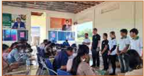
វគ្គបណ្តុះបណ្តាលស្តីពី “ការពង្រឹងការស្វែងយល់ អំពីវត្តមានជួញដូរមនុស្ស និងការរំលោភបំពាននានា និងតួនាទីអ្នកស្ម័គ្រចិត្តក្នុងការចូលរួមប្រឆាំងការជួញដូរមនុស្សនៅក្នុងសហគមន៍” (ចំនួន ០២វគ្គ ជូនចំពោះអ្នកស្ម័គ្រចិត្ត ៥១នាក់ (ស្រី១៣នាក់) ពីភូមិទាំង២៩ របស់ស្រុកកំរៀង)