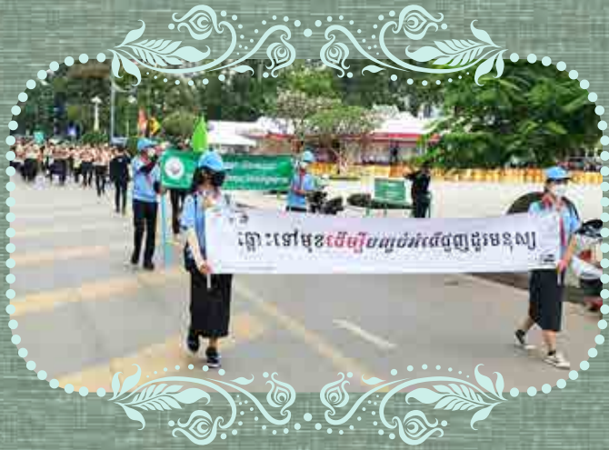
ខេត្តសៀមរាប៖ យុទ្ធនាការ ព្យហយាត្រា «គ្រោះទៅមុខ ដើម្បីបញ្ឈប់អំពើពុករលួយមនុស្ស»

«យើងគ្នា ប្រយុទ្ធប្រឆាំងនឹងការជួញដូរមនុស្ស និងអំពើពុករលួយមនុស្ស ដើម្បីការពារ និង លើកកម្ពស់ សិទ្ធិ និងសេចក្តីថ្លៃថ្នូរ របស់មនុស្សជាតិ»