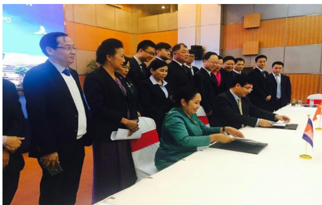
ពិធីចុះហត្ថលេខាលើកិច្ចព្រមព្រៀង