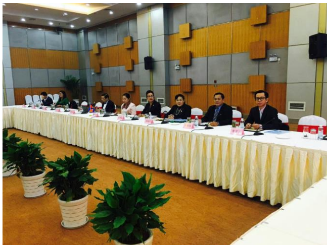
កិច្ចប្រជុំរវាងភាគីកម្ពុជា ចិន