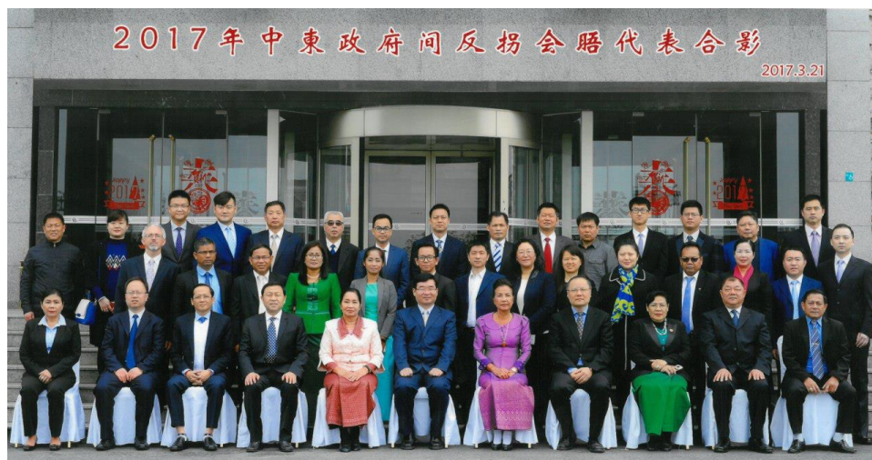
រូបថតអនុស្សាវរីយ៍